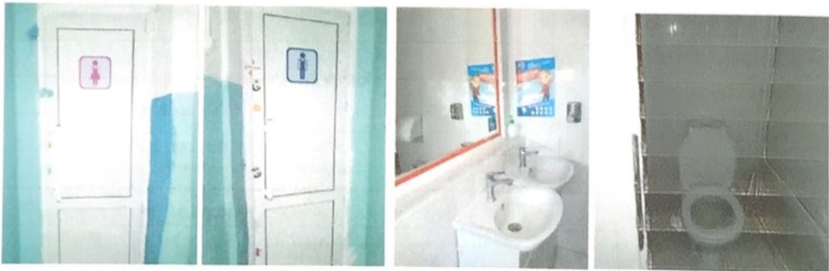
37. Фото «Санитарное состояние помещений организации» (фото размещается только при заявлении показателя в справке)